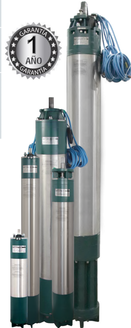
MOTORES SUMERGIBLES REBOBINABLES DE 6", 8", 10" Y 12" (60hz, 2 polos, 3450rpm)